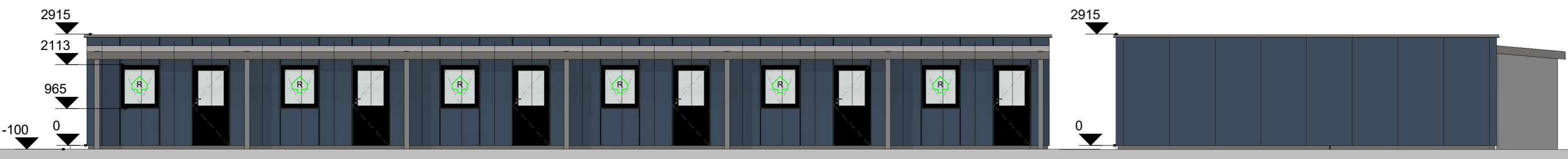
Øst 1 : 100